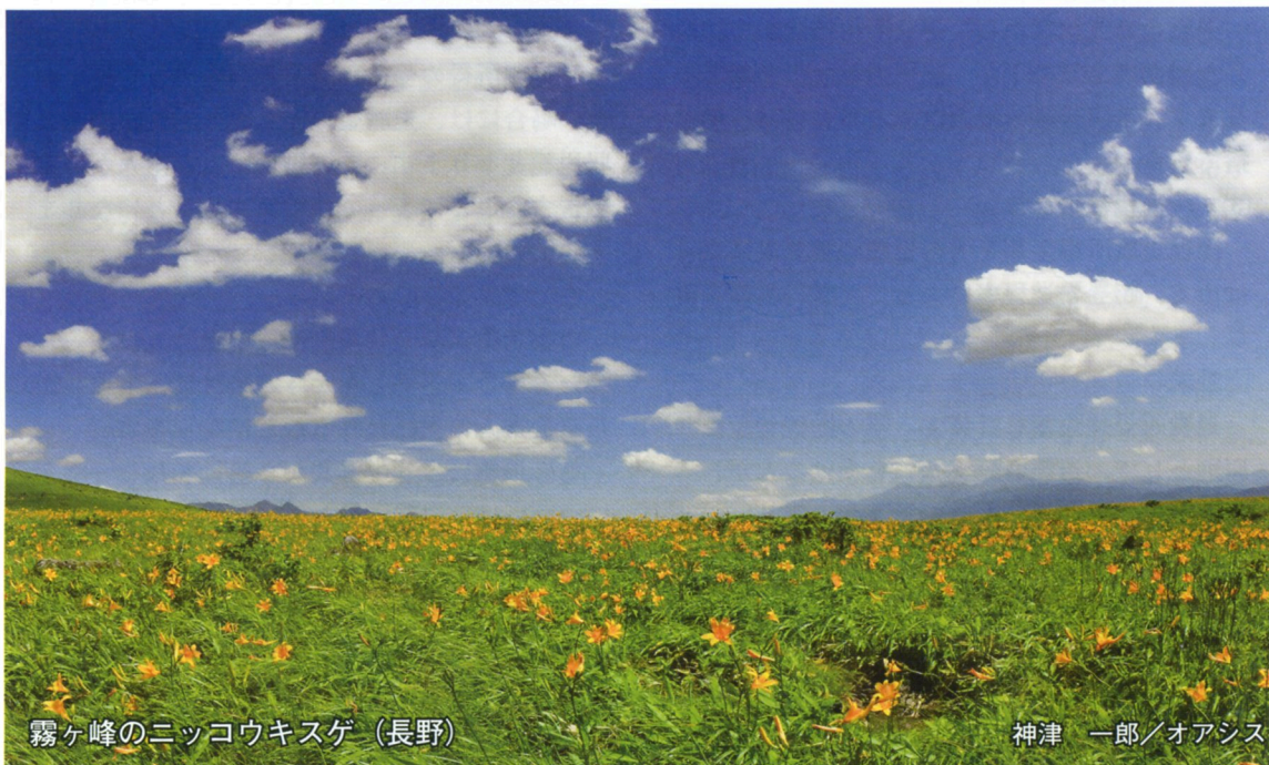
霧ヶ峰のニッコウキスゲ（長野）